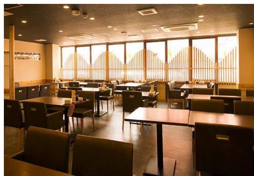
古民家個室居酒屋 尺三寸水 有楽町店