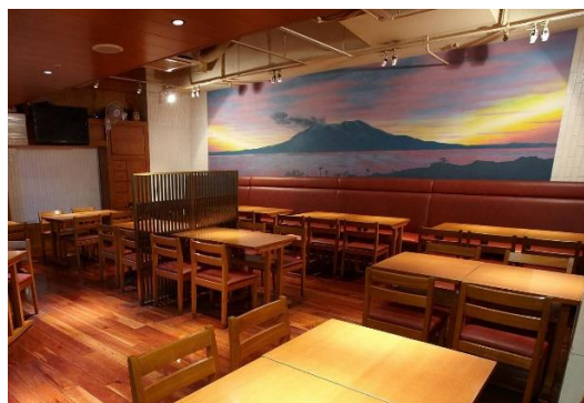
麴蔵 有楽町晴海通り本店